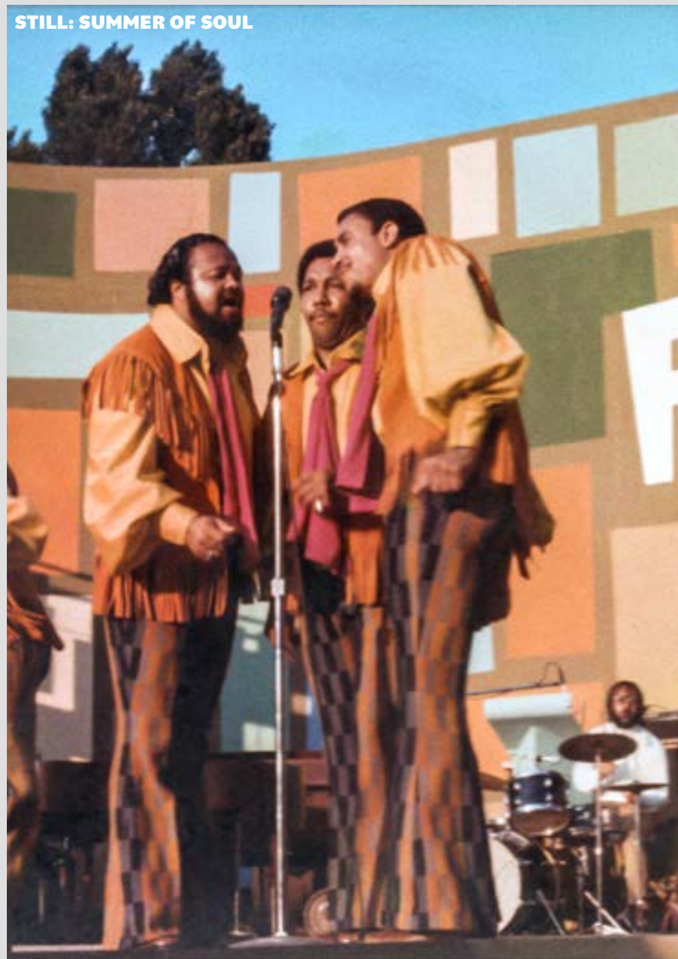
STILL: SUMMER OF SOUL

Hoewel het beeld en het geluid in het filmtheater vele malen beter is dan bij de gemiddelde thuis kijker, proberen we bij Natlab het publiek ook op andere manieren te trekken. De totaalbeleving van een avondje uit in combinatie met de horeca wordt steeds belangrijker, al gooide ook hier Corona roet in het eten doordat de horeca voor lange termijn niet of nauwelijks open kon zijn.