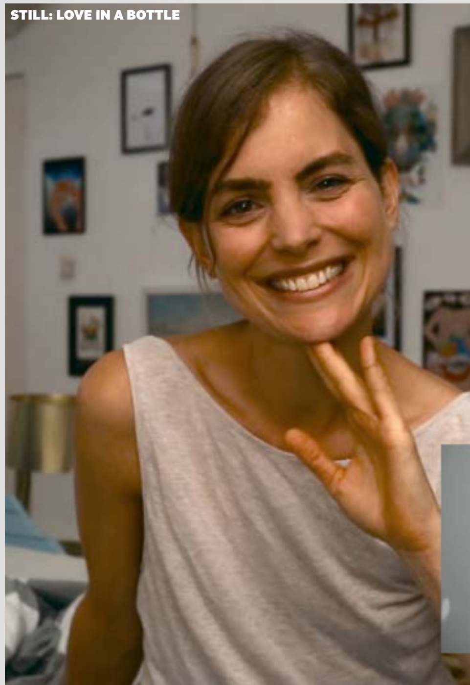
STILL: LOVE IN A BOTTLE