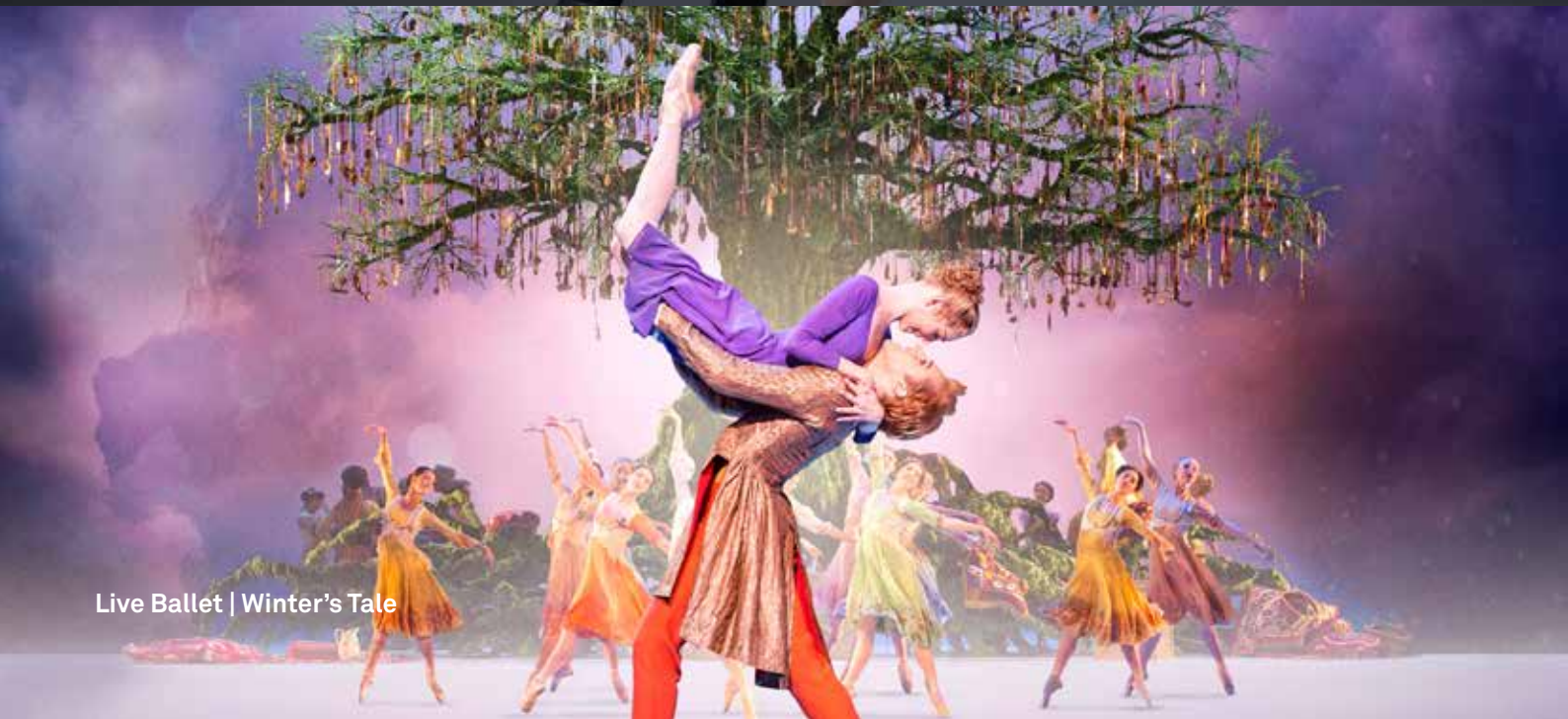
Live Ballet | Winter's Tale