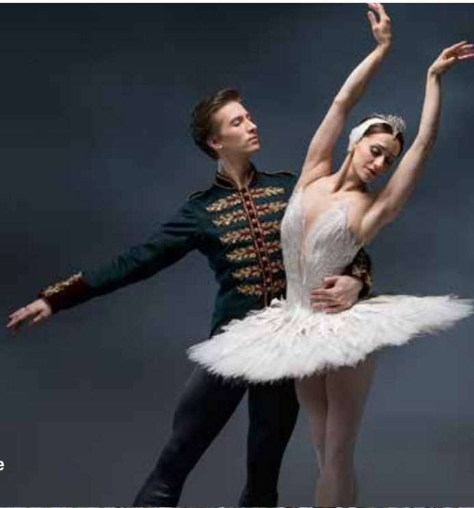
Live Ballet | Swan Lake

Daarnaast vertoonden we de bijzondere voorstellingen van Arts in Cinema, waarin tentoonstellingen van wereldberoemde kunstenaars naar het grote doek werden vertaald. David Hockney, Vermeer, Cezanne, Caravaggio, Hitler versus Picasso, Van Gogh, Raphael en Botticelli passeerden de revue.