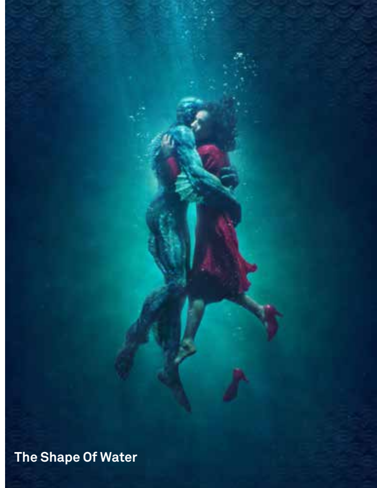
The Shape Of Water

De Betere Filmpas heeft in 2018 744 leden en de Plazapas 824.